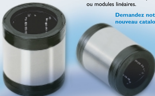
Type SL ECONOMIC